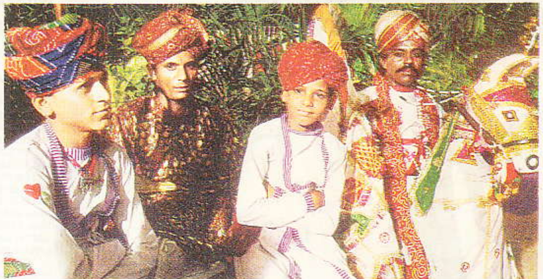
Rajasthan Diwas will be celebrated in Kolkata between March 25 and 30

Bengal governor Gopal Krishna Gandhi, who will be accompanied by four other state governors (all of them hailing from the state of Rajasthan), will inaugurate the