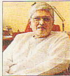
Gopal Krishna Gandhi