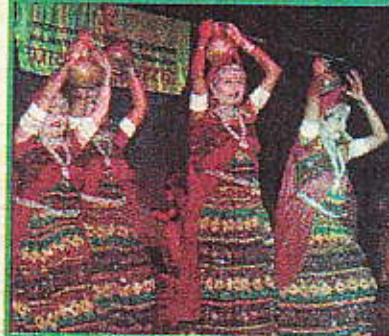
कार्यक्रम के दौरान राजस्थानी नृत्य का अभिनव दृश्य। -विश्वमित्र

मंडली के अनुसार संस्थाओं में प्रथम मरूधारा, द्वितीय राजस्थान कला संगम एवं बांगुर एवेन्यू संसद तीसरे स्थान पर रही जबकि स्कूलों में नृत्य में उर्वशी प्रथम एवं माहेश्वरी गर्ल्स स्कूल दूसरे स्थान पर, राजस्थानी गीतों में माहेश्वरी गर्ल्स स्कूल, हावड़ा शिक्षा सदन क्रमशः प्रथम और द्वितीय एवं राजस्थानी वेश-भूषा के लिए ज्ञान भारती और मारवाड़ी बालिका विद्यालय