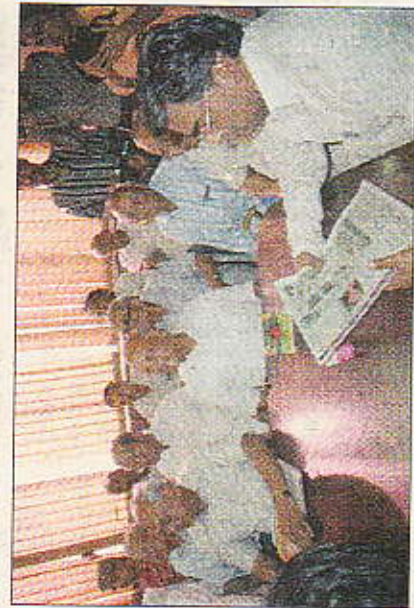
समारोह में मौजूद अतिथि.

कोलकाता, 30 मार्च : स्वतंत्रता आंदोलन को दिशा देने व संग्रामियों को पनाह देने के लिए राजस्थान का इतिहास स्वर्ण अक्षरों में कलमबंद होगा. उक्त बातें आज सांसद मो सलीम ने कहीं. वह आज राजस्थानी प्रचारिणी सभा व राजस्थानी सूचना केन्द्र के संयुक्त तत्वावधान में राजस्थान दिवस को शहादत दिवस की 75 वीं सालगिरह के रूप में आयोजित