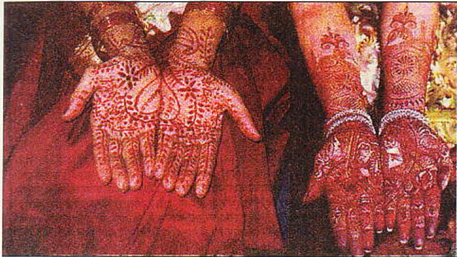
राजस्थान फाउण्डेशन द्वारा आयोजित मेंहदी रचना प्रतियोगिता में प्रतिभागी।