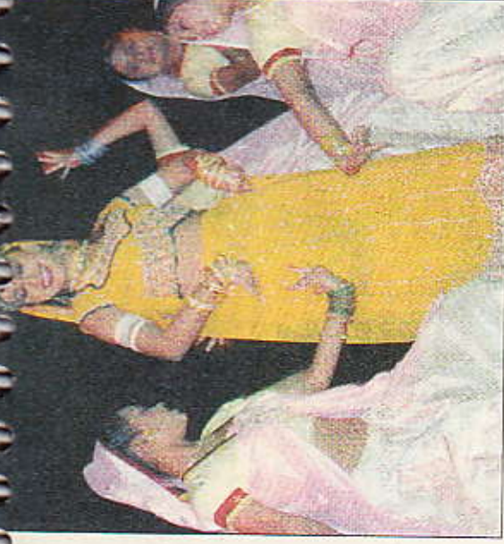
समारोह में राजस्थानी नृत्य पेश करती टॉलीवुड की अभिनेत्री ऋतुपर्णा सेनगुप्त.