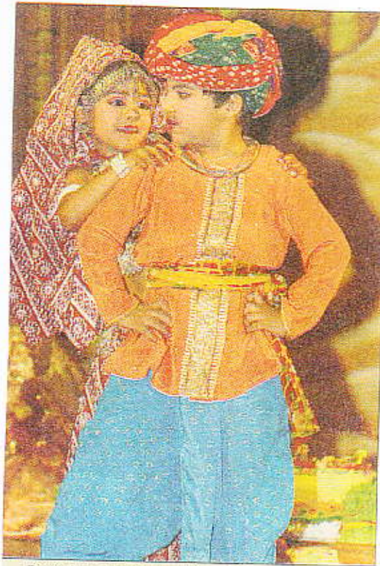
Rajasthan Foundation Day celebrations get off to a colourful start at Gyan Manch on Sunday. Monday's events have been postponed as tribute to Anil Biswas.

METRO THE TELEGRAPH CALCUTTA MONDAY 27 MARCH 2006