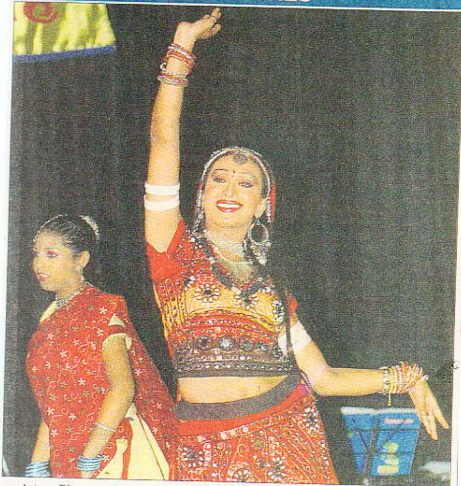
Actress Rituparna Sengupta in traditional gear joins dancers on stage at a function to mark Rajasthan Diwas at GD Birla Sabhagar on Thursday evening.